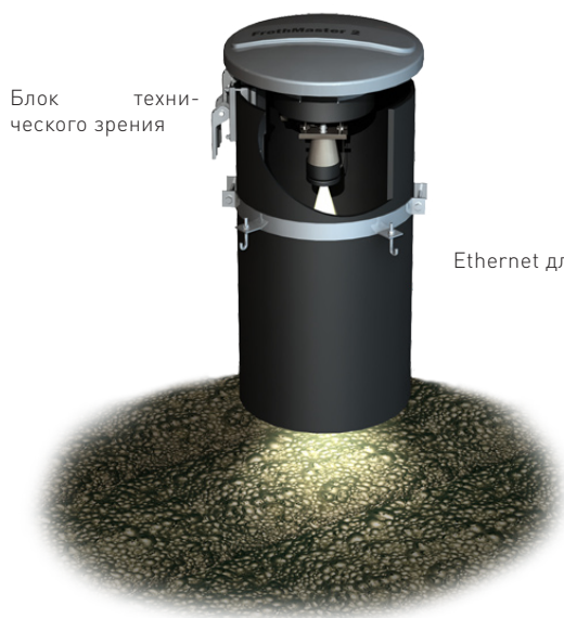
Блок технического зрения